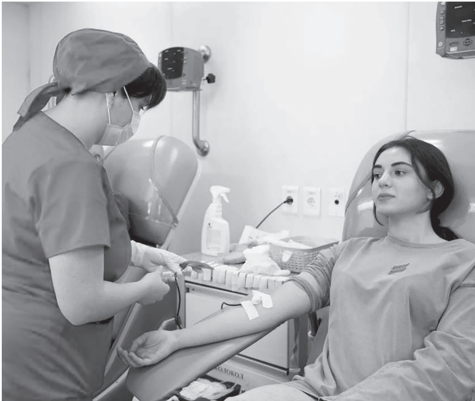
Студенты и преподаватели КЧГУ регулярно принимают участие в донорских акциях

В Карачаево-Черкесском государственном университете прошла донорская акция