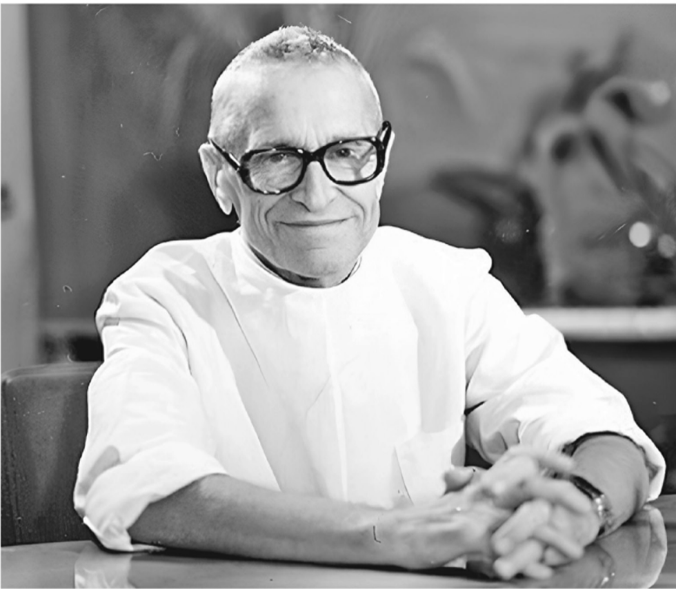
Амосов Николай Михайлович

— Из неопубликованных дневников Николая Амосова, 1989 г.