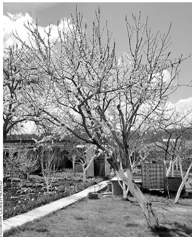
Белят и ствол, и основания скелетных ветвей

Очистку проводят только по влажной земле или на расстеленную пленку/мешковину, чтобы потом уничтожить мусор. Мусор рекомендуется сжигать, так как в нем могут находиться споры